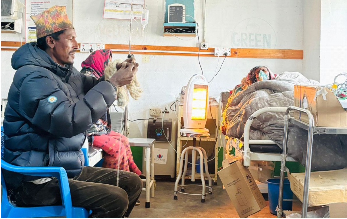
हुम्लाको एक मात्रै जिल्ला अस्पतालमा भर्ना भएका बिरामीका साथै बिरामी कुरवा बसेका नागरिक काम गर्दै। यो उनबाट बनेका लिउ, फेरुवा लगायत बन्छन्।

वर्ष १ अंक : १७५ बुधवार ०७ फागुन, २०८१ 19 (Wednesday) February 2025 पृष्ठ ४, मूल्य रु : १०१-